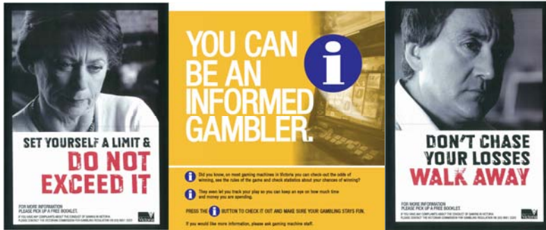
c) La disponibilità di servizi di supporto