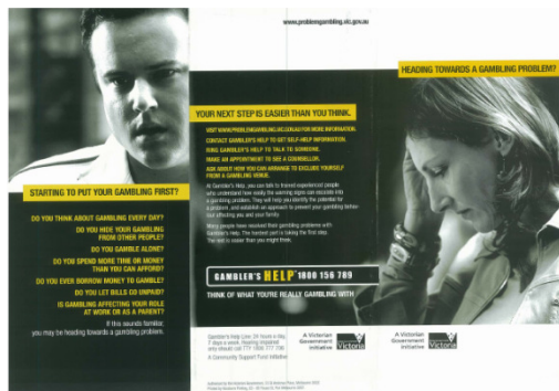
d) Il pagamento delle vincite politica